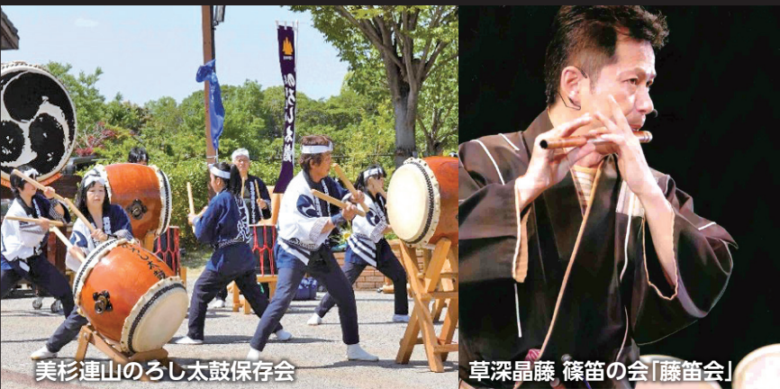
美杉連山のろし太鼓保存会

15時30分～16時30分 場所 美杉ふるさと資料館 〈定員30名程度〉※事前申込不要